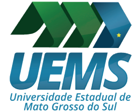
Universidade Estadual de Mato Grosso do Sul (UEMS-Brasil).

Escuela Superior licenciada por el MINEDU. Referente en creatividad con casi cuatro décadas de trayectoria formando en carreras creativas que impulsan el desarrollo del país desde la innovación y la creatividad.