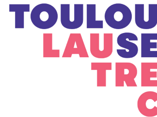
Escuela de Educación Superior Tecnológica Toulouse Lautrec (Perú)

Centro de Investigación de la UCAL cuya misión es promover una cultura de la investigación científica ética, con un enfoque innovador y sostenible como huella identitaria de la comunidad de UCAL, proponiendo, liderando y apoyando proyectos de investigación con participación de su comunidad docente, estudiantil y administrativa en equipos locales e interinstitucionales, tanto nacionales como internacionales, de alto nivel.